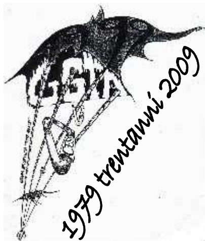
Gruppo Speleologico Terre Arnolfe