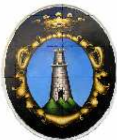
Pro Loco Cesi